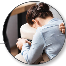
• Séance assise (20mn/pers.)