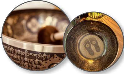
• Séance d'Ancre (15mn/pers.)